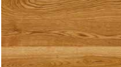
Bona Craft Oil 2K – Neutral