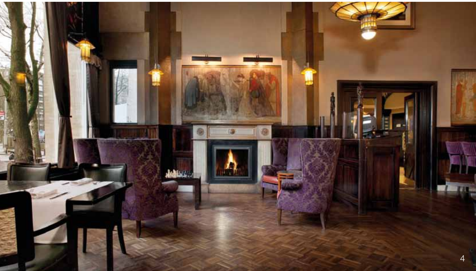
American Hotel, Amsterdam: Bona Craft Oil 2K (Neutral) op Wengé