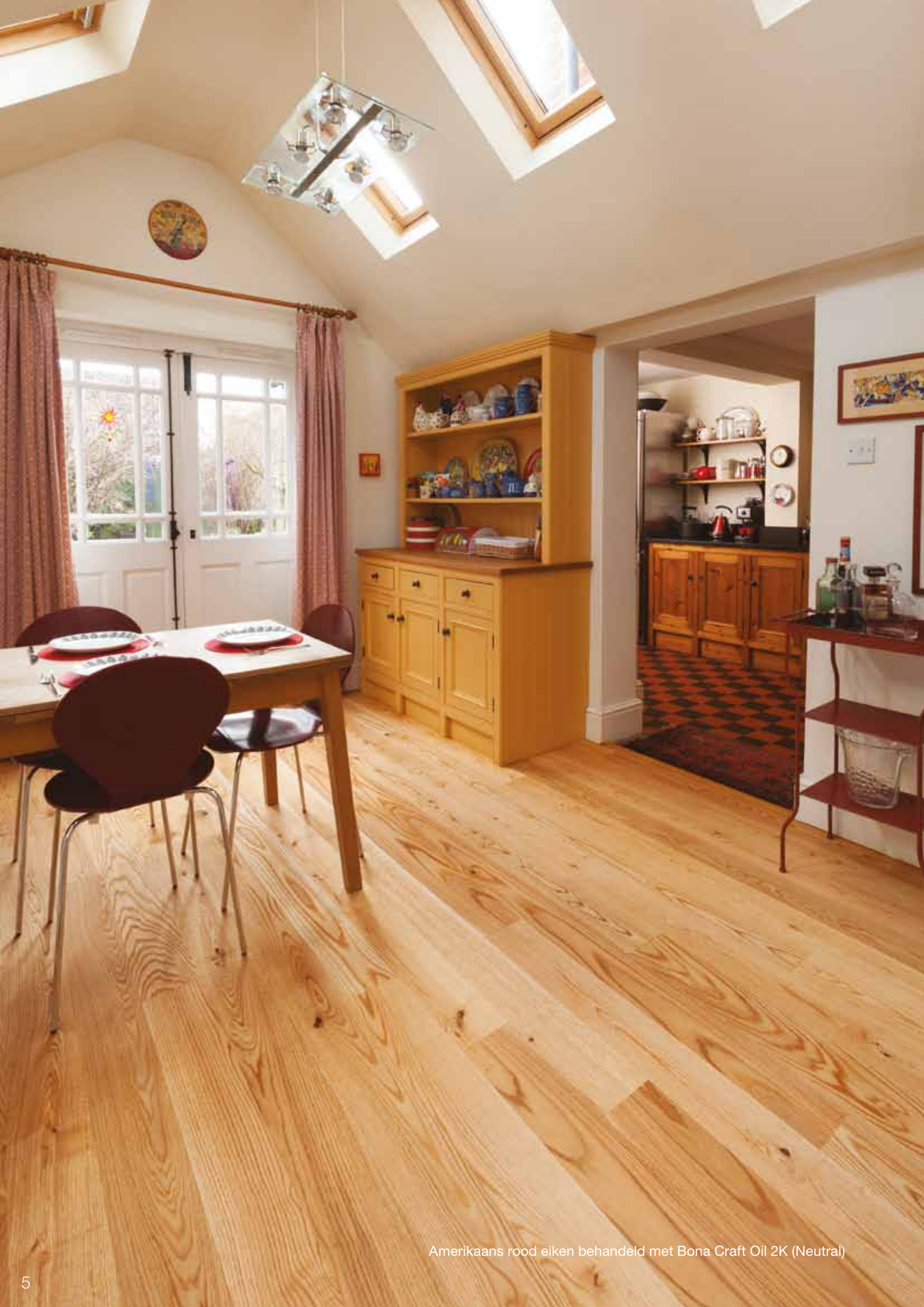
Amerikaans rood eiken behandeld met Bona Craft Oil 2K (Neutral)