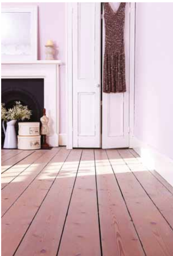
Bona Craft Oil 2K (Ash) geeft een rustige uitstraling aan Victoriaanse planken