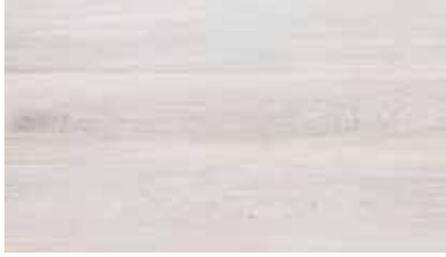
Bona Craft Oil 2K (Ash)